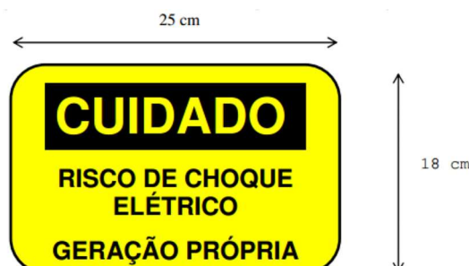
Figura 2 – Modelo de placa de advertência